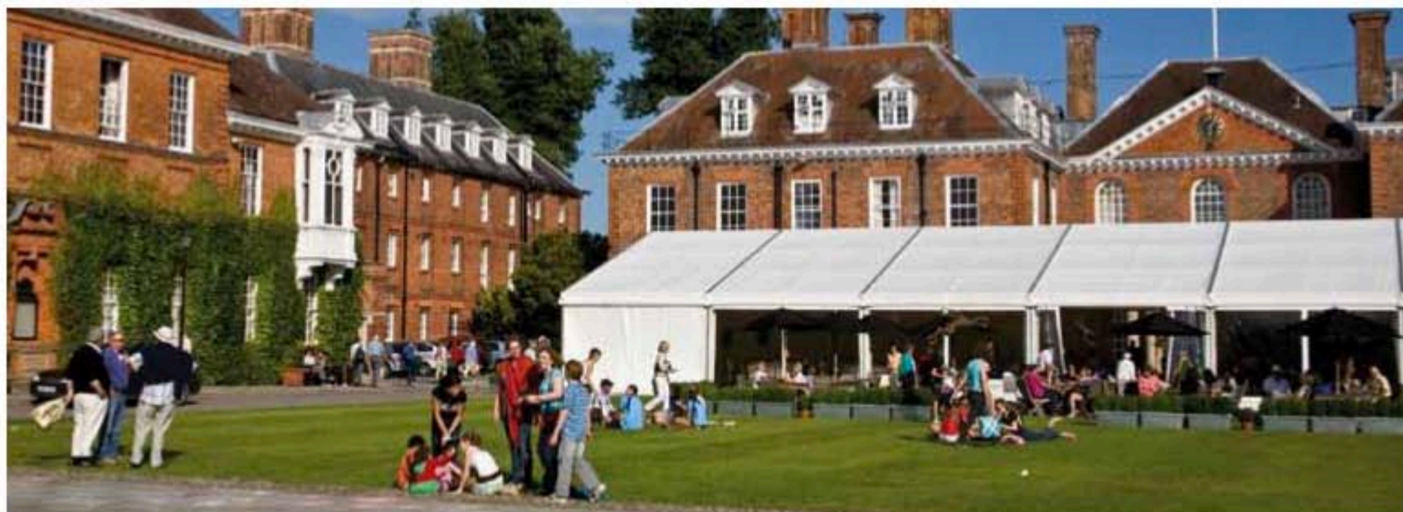
SCHMIEDE FÜR PRINZESINNEN: Kate Middleton und ihre fast schon ebenso berühmte Schwester Pippa absolvierten das Marlborough-College, eine teure Privatschule mit Internat. Kate ging später auf die St. Andrews University und lernte dort ihren Prinzen kennen.

Portion andere Wirklichkeit an: Exkursionen in die Armut. Das Collège Beau Soleil hat eine Stiftung für benachteiligte Kinder in Indien. Jeweils eine kleine Gruppe von Beau Soleil-Schülern fährt einmal im Jahr nach Indien, um die indischen Kindern zwei Wochen lang zu unterrichten. Le Rosey unterstützt finanziell eine Schule in Mali, auch dorthin begeben sich jedes Jahr einige Rosécens. Zwar nicht eines der Reichen-Internate, aber doch eine Schweizer Schule soll auch der jüngste Sohn des nordkoreanischen Diktators Kim Jong-il besucht haben. Allerdings unter falschem Namen und offiziell als Sohn des Chauffeurs der Botschaft. Erst vor zwei Jahren, als Kim Jong-un als möglicher Nachfolger seines kranken Vaters in Erscheinung trat, kam die Story ans Licht. Die International School of Berne, in die er ging, wird häufig von Diplomatenkindern besucht. Kim Jong-un – wenn er es denn war – spielte gerne Basketball, wissen wir nun.