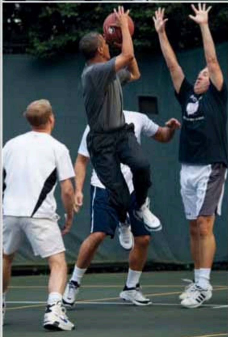
FITTER PRÄSIDENT. Als Jugendlicher wollte Barry Obama professioneller Basketballer werden. Dazu reichte sein Talent schließlich nicht. Stattdessen wurde er US-Präsident. Und spielt nun mit Kongressabgeordneten.