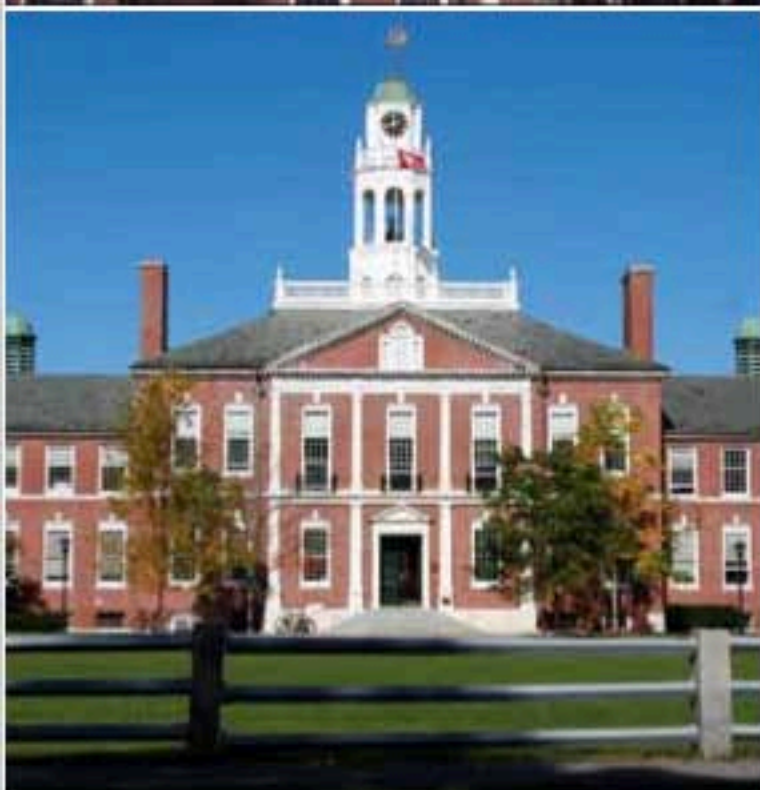
NOBEL-SCHULE Die Phillips Exeter Academy in New Hampshire/USA. Für künftige US-Präsidenten interessant: der Unterricht findet an einem ovalen Tisch statt.

halbe Welt, um ihre Schule zu präsentieren und potenzielle Schüler und Schülerinnen zu begutachten. Im Februar waren sie in Mumbai, im April in Sao Paulo, Miami und New York. Früher galt Le Rosey als „Schule der Könige“ – der spätere Schah Reza Pahlevi war dort, Sprösslinge europäischer Königshäuser und Potentaten aus Afrika und Arabien. Dazu gesellten sich Rockefeller und Rothschilds und die Kinder von Hollywoodstars. Seit König ein rarer Beruf geworden ist, übernehmen Neureiche aller Provenienz die frei gewordenen Plätze. So begaben sich ab Mitte der 1990er-Jahre die Kinder russischer Oligarchen nach Le Rosey – und mit ihnen angeblich auch deren raue Sitten.