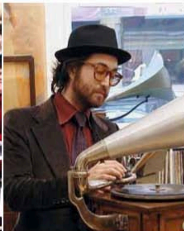
HIPPIE-KIND: Sean Lennon, Sohn von John & Yoko, war ein reiches Hippiekind. Er verbrachte einige Jahre in der „Schule der Könige“.