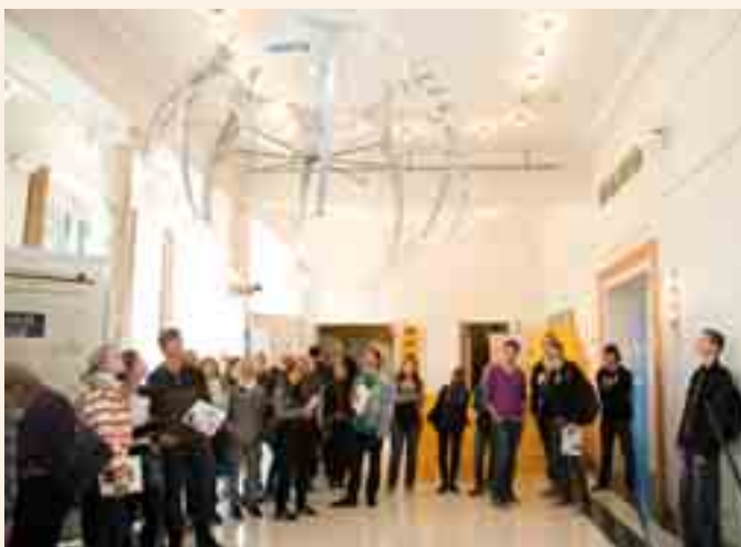
Bionik ist ein neues Forschungsfeld, das die Welt verändern könnte